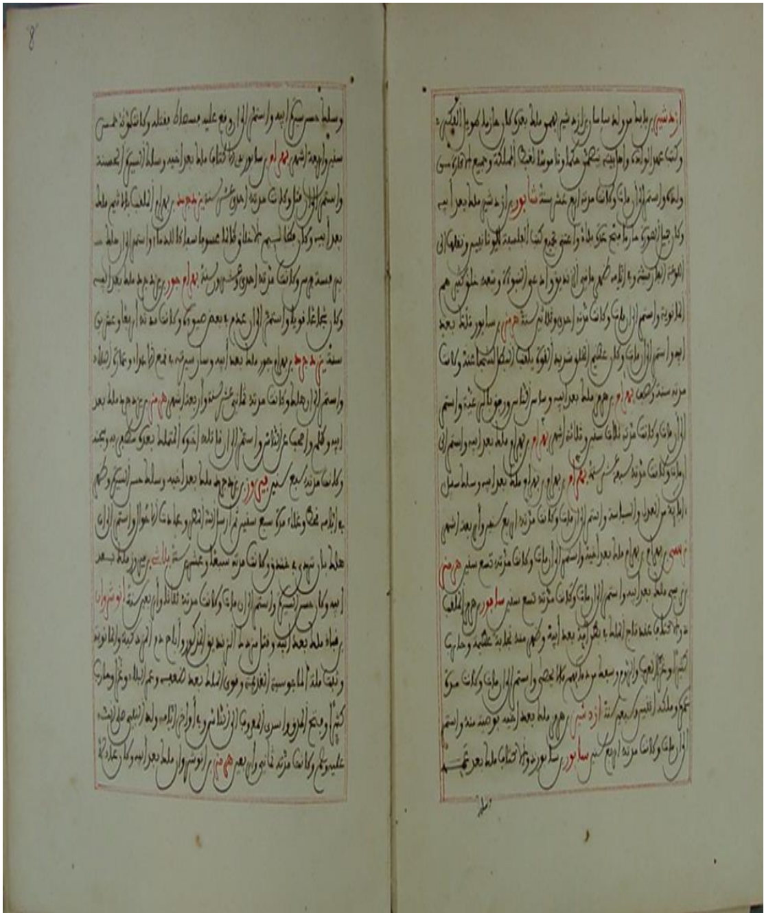
نموذج من صفحات المخطوط بما يخص موضوع الدراسة