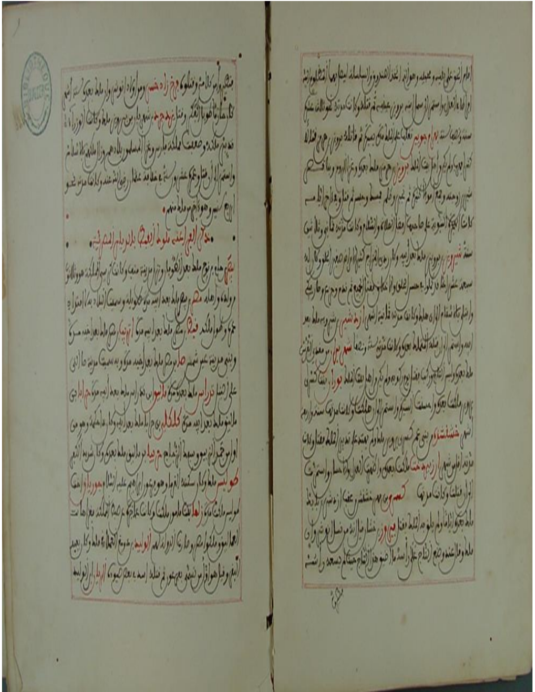
لوحة رقم (٩)